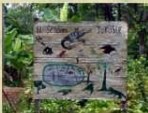
AAMVECONA - Avistamiento de Manatíes