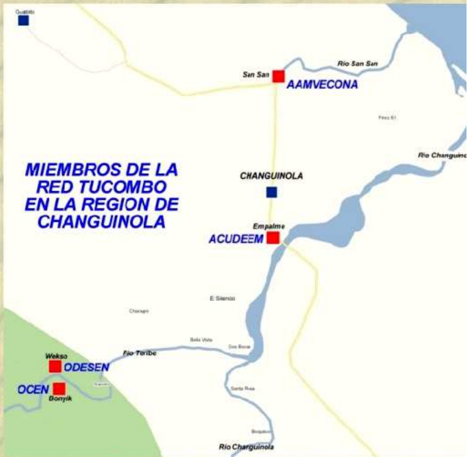
OCEN - Río Teribe