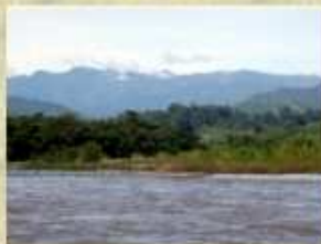
ODESEN - Sendero Las Heliconias