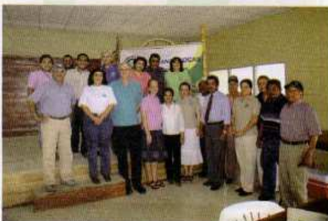
Miembros de la Embajada de Noruega y de la UICN, visitan Bocas del Toro, mayo de 2007.