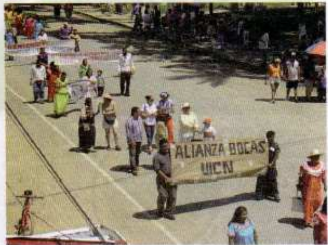
Mujeres artesanas marchan por las calles de Bocas del Toro durante la Primera Feria Artesanal, octubre 2005.

Una vez terminada la primera etapa del Proyecto Alianzas (Alianzas I) que abarcó los años 2004-2009, la cooperación Noruega accedió a financiar una segunda fase (Alianzas II) 2010-2011, con el fin de consolidar lo logrado hasta entonces y dejar establecidas seis coaliciones que tendrán en sus manos el futuro del desarrollo sostenible de nuestras comunidades y del país.