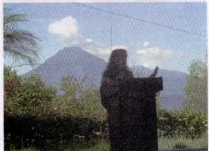
Grethel Aguilar inaugura el Encuentro de Alianzas en Panajachel, Guatemala, octubre de 2007.