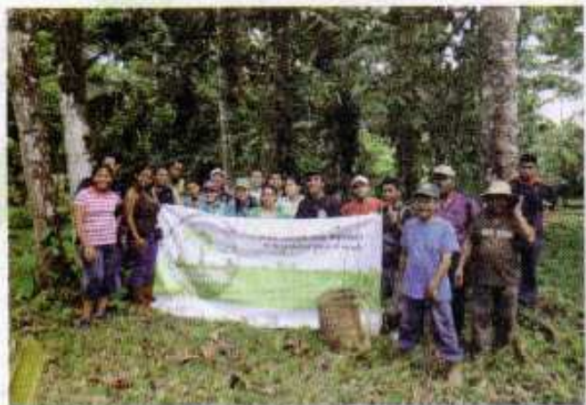
Jóvenes de Alianza Bocas participando en la campaña Reforestando Centroamérica, junio de 2011.