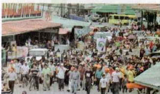
Marcha de los Pueblos Originarios por las calles de Changuinola, agosto de 2010.